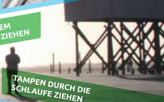
TAMPEN DURCH DIE SCHLAUFE ZIEHEN