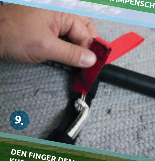
DEN FINGER DEM ROTEN KLETTBAND (ZUERST MIT DEM KURZEN UND DANACH DEM LANGEN ENDE) SICHERN