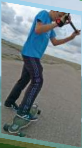
EINSTIEG IN DAS STREETKITING MIT KLEINER MONO AUF DEM LONGBOARD