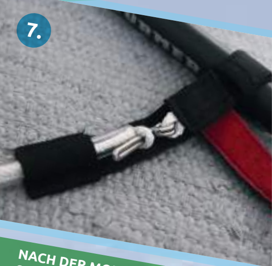
DEN METALLFINGER UMLEGEN