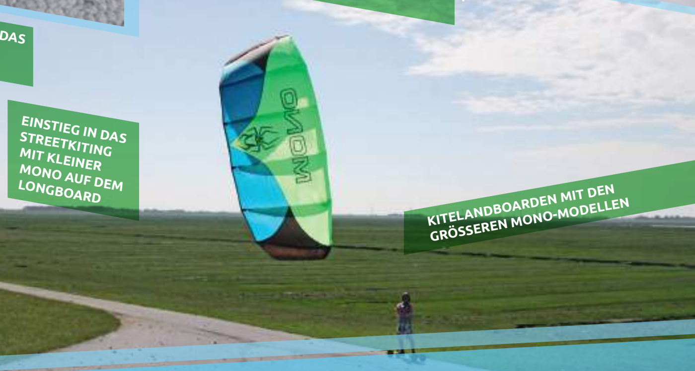
KITELANDBOARDEN MIT DEN GRÖßEREN MONO-MODELLEN